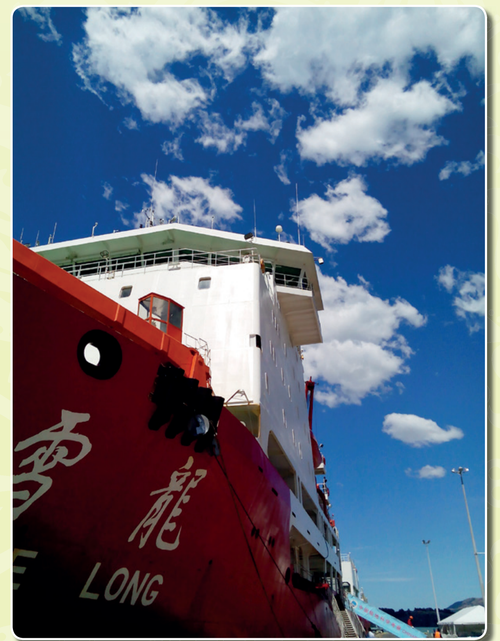
การดำเนินงานของนักวิจัยตามความร่วมมือ วันที่ 2 พ.ศ. 2558