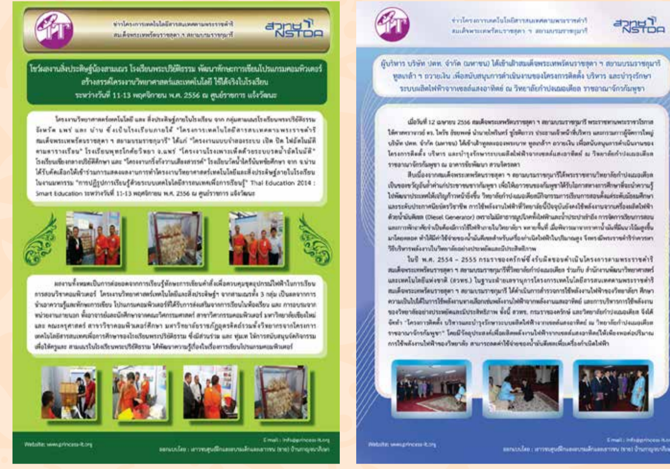
ผลงานออกแบบ จดหมายข่าวโครงการฯ