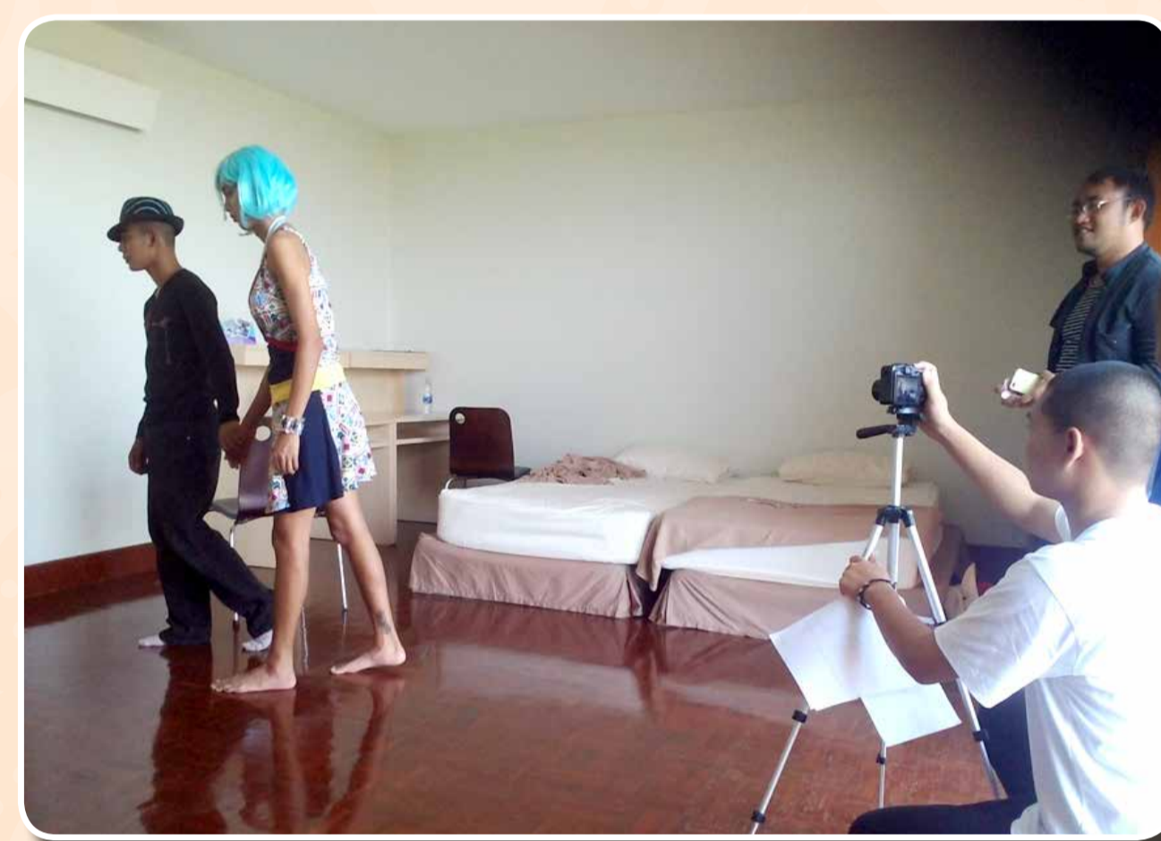
ค่ายจัดทำ Stop Motion รูปแบบ Pixilation (จัดทำ Stop Motion โดยใช้การแสดง มีเนื้อหารณรงค์เรื่องต่างๆ)