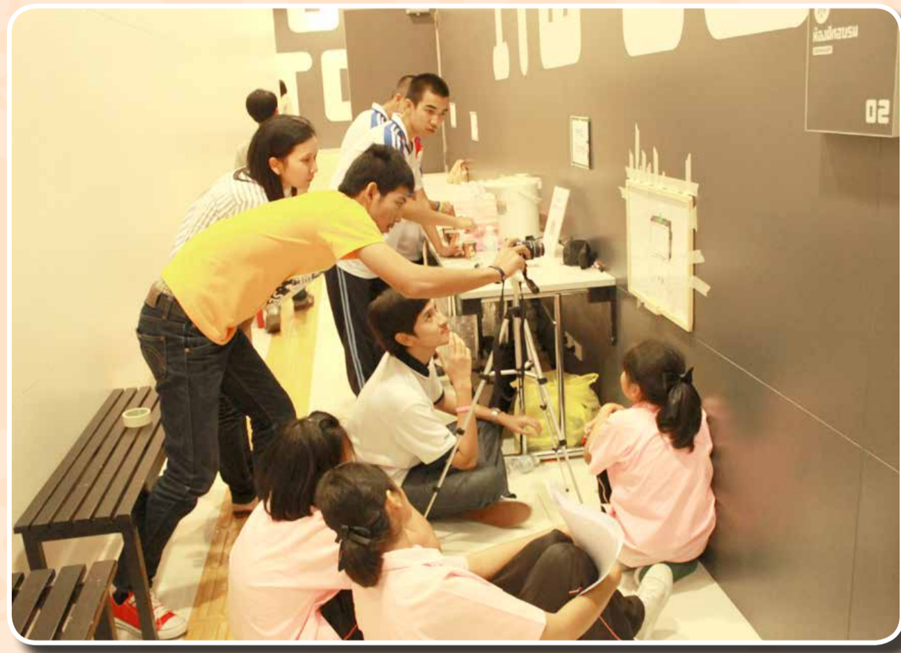
เป็นผู้ช่วยวิทยากรสอนเด็กประถมศึกษาในงาน “การสร้างสื่อ ดิจิทัลสร้างสรรค์เพื่อการรู้เท่าทันสื่อ” ณ TK park