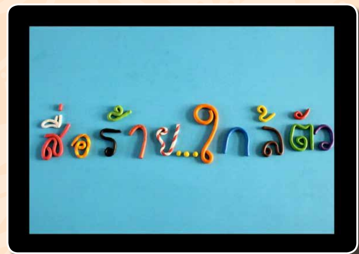
เรื่อง สื่อร้าย..ใกล้ตัว โดย ศูนย์ฝึกฯ บ้านกาญจนาภิเษก (ได้รับรางวัลจากกระทรวงวัฒนธรรม)