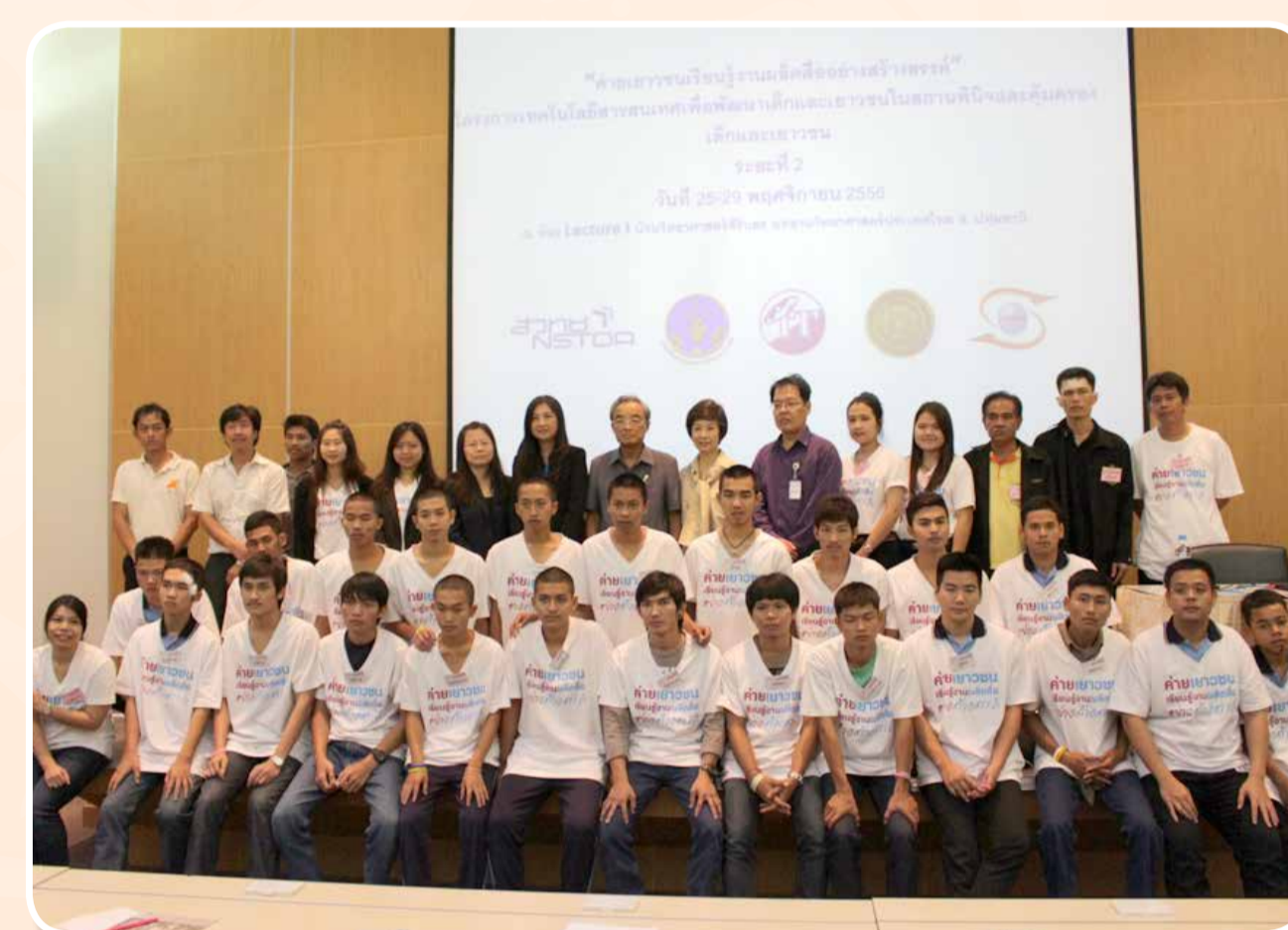
ค่ายเยาวชนเรียนรู้งานผลิตสื่ออย่างสร้างสรรค์ (วาดรูปการ์ตูน, หลักการออกแบบ, การใช้สี)