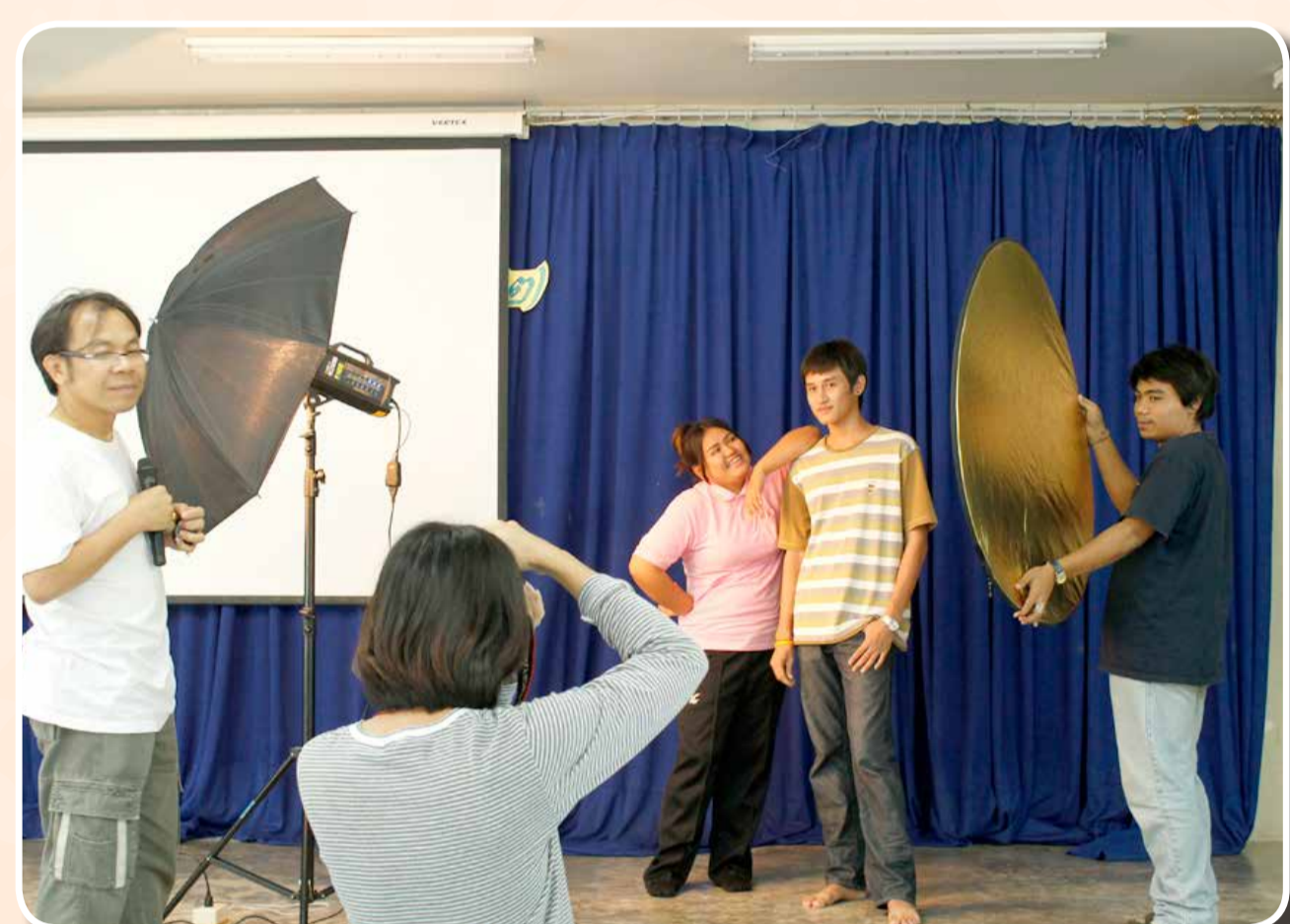
การอบรมโอทีหลักสูตรพื้นฐาน ได้แก่ ถ่ายภาพเบื้องต้น, สร้างการ์ตูนจากภาพถ่าย, การออกแบบกราฟิกขั้นสูง, การทำเว็บไซต์