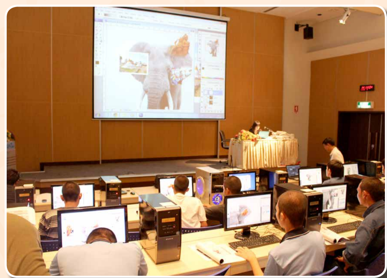
ค่ายเยาวชนแกนนำสู่การเป็นผู้นำด้านกราฟิก (คอมพิวเตอร์กราฟิกเบื้องต้น, วาดรูปการ์ตูนด้วย คอมพิวเตอร์, การออกแบบโปสเตอร์)