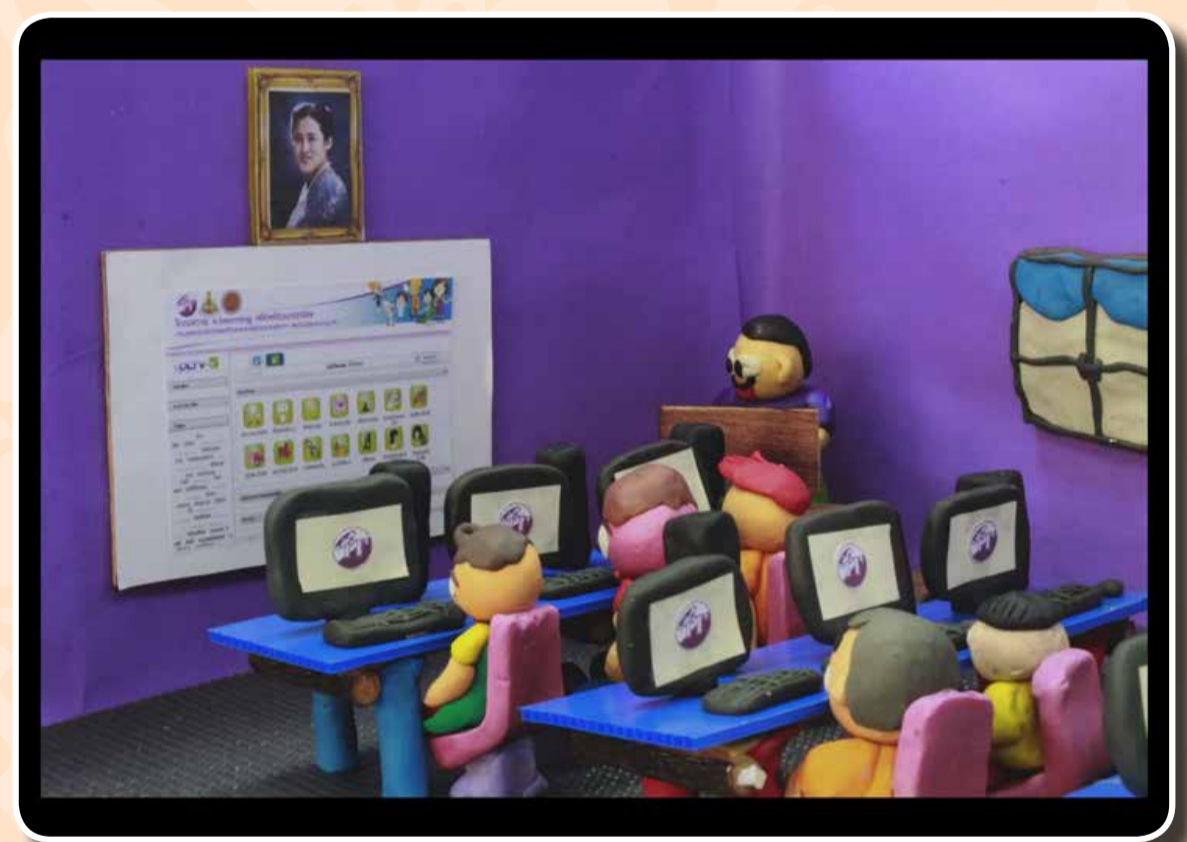
เรื่อง ก้าวที่พลาด สู่อากาศที่เปลี่ยนแปลง โดย เยาวชนศูนย์ฝึกฯ 5 แห่งเพื่อเทิดพระเกียรติ สมเด็จพระเทพรัตนราชสุดาฯ สยามบรมราชกุมารี