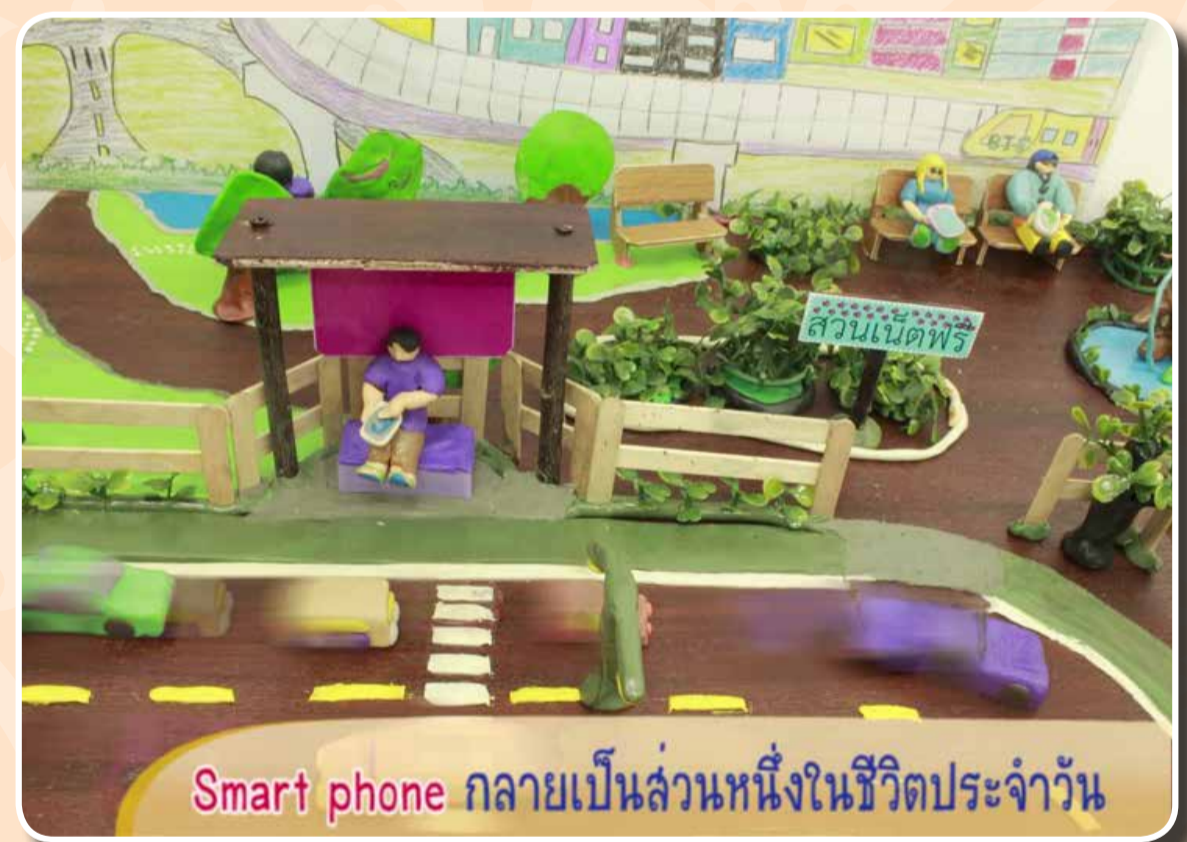
เรื่อง เหยื่อลวง โดย ศูนย์ฝึกฯ บ้านกรูณา