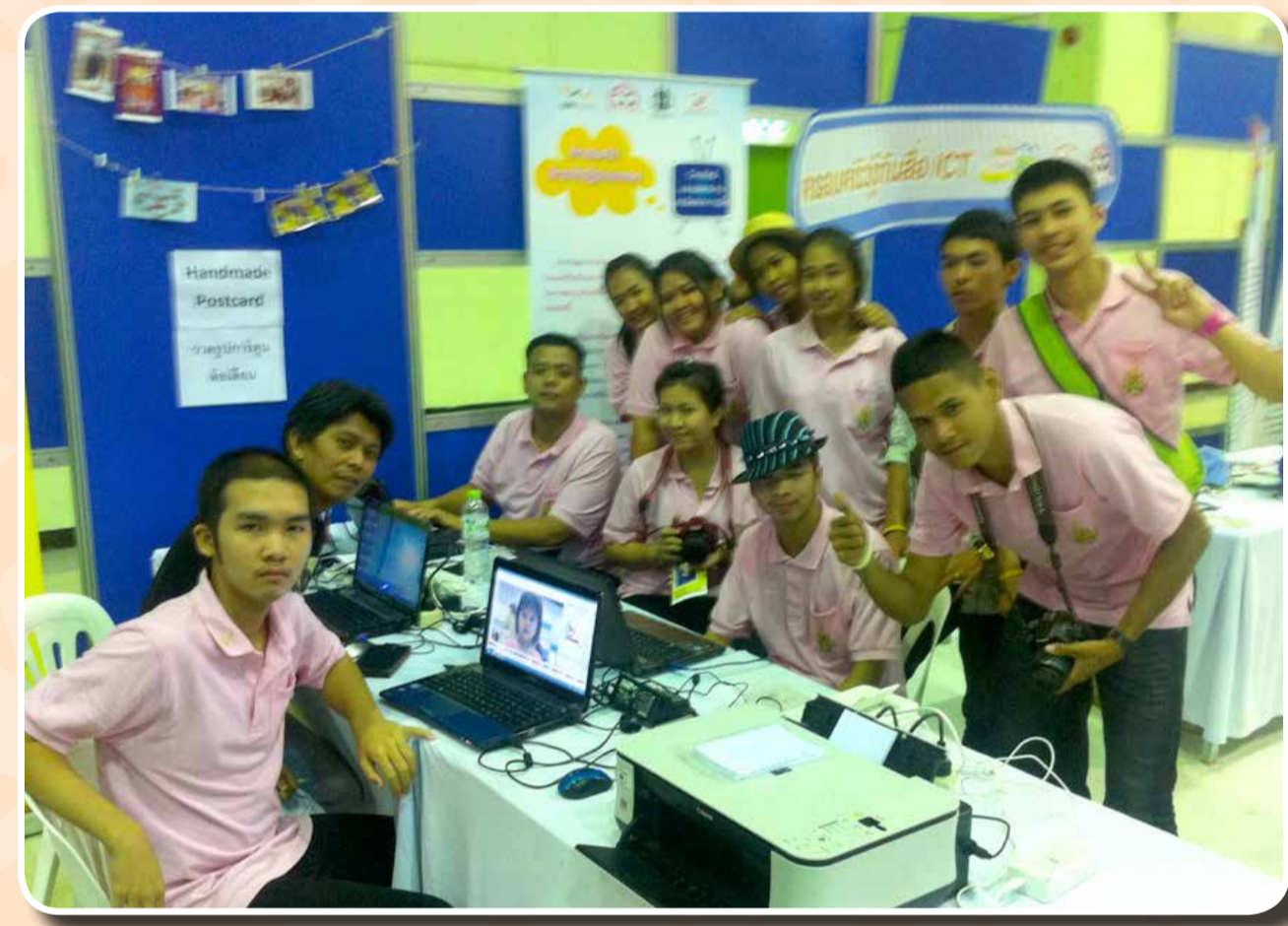
ร่วมจัดบูทกิจกรรมไอซีที “งานครอบครัวสุขสันต์ สร้างสรรค์สังคมไทย” ณ เดอะมอลล์บางกะปิ