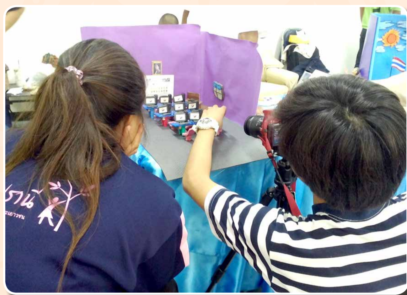
ค่ายจัดทำ Stop Motion เพื่อเทิดพระเกียรติ สมเด็จพระเทพรัตนราชสุดาฯ สยามบรมราชกุมารี