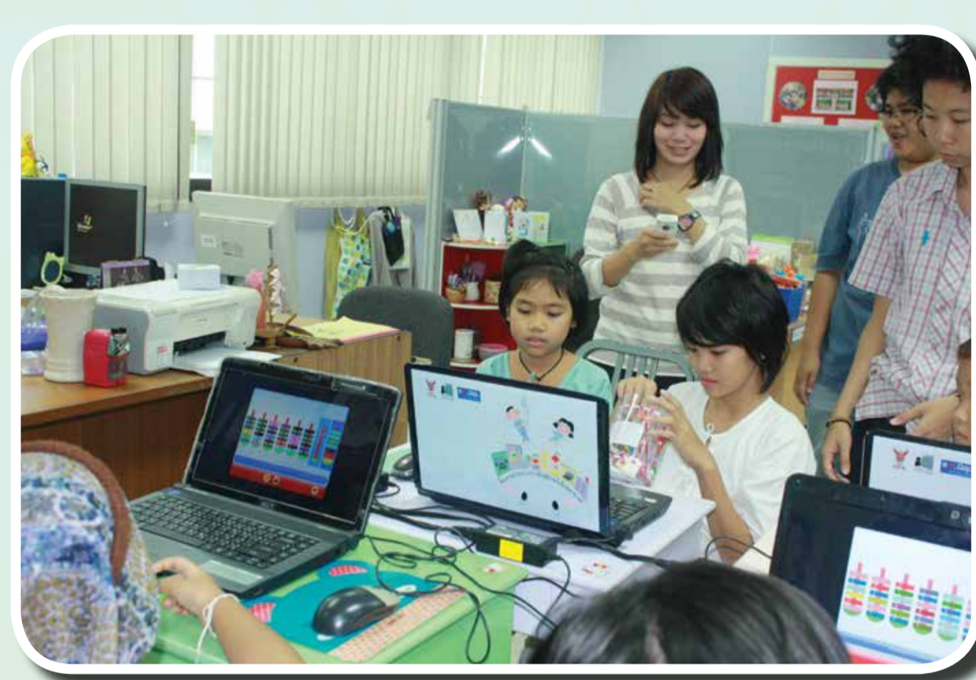
มูลนิธิระจกเงามาร่วมจัดกิจกรรมที่สถาบันสุขภาพเด็กแห่งชาติมหาราชินี