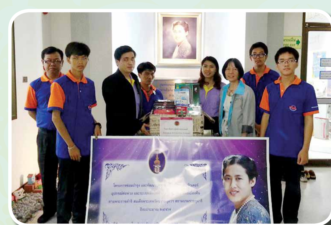
วิทยาลัยสารพัดช่างพระนครมอบอุปกรณ์คอมพิวเตอร์ และซ่อมบำรุงคอมพิวเตอร์ ให้กับศูนย์ฯ ในเขตกรุงเทพฯ

ศูนย์เครือข่ายเทคโนโลยีสารสนเทศเพื่อเด็กป่วยในโรงพยาบาล ตามพระราชดำริ สมเด็จพระเทพรัตนราชสุดา ฯ สยามบรมราชกุมารี