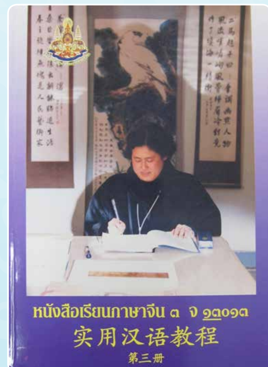
หนังสือเรียนภาษาจีนของมูลนิธิการศึกษาทางไกลผ่านดาวเทียม