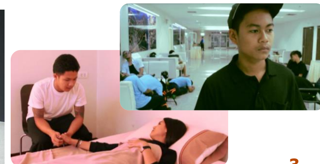
ภาพประกอบจากหนังสือของเยาวชน