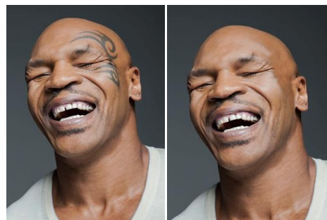
ผลงานตกแต่งภาพ